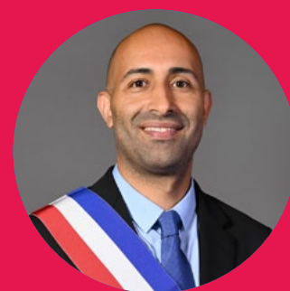
Shems El Khalfaoui Maire adjoint aux sports, aux grands événements et aux Jeux Olympiques et Paralympiques 2024